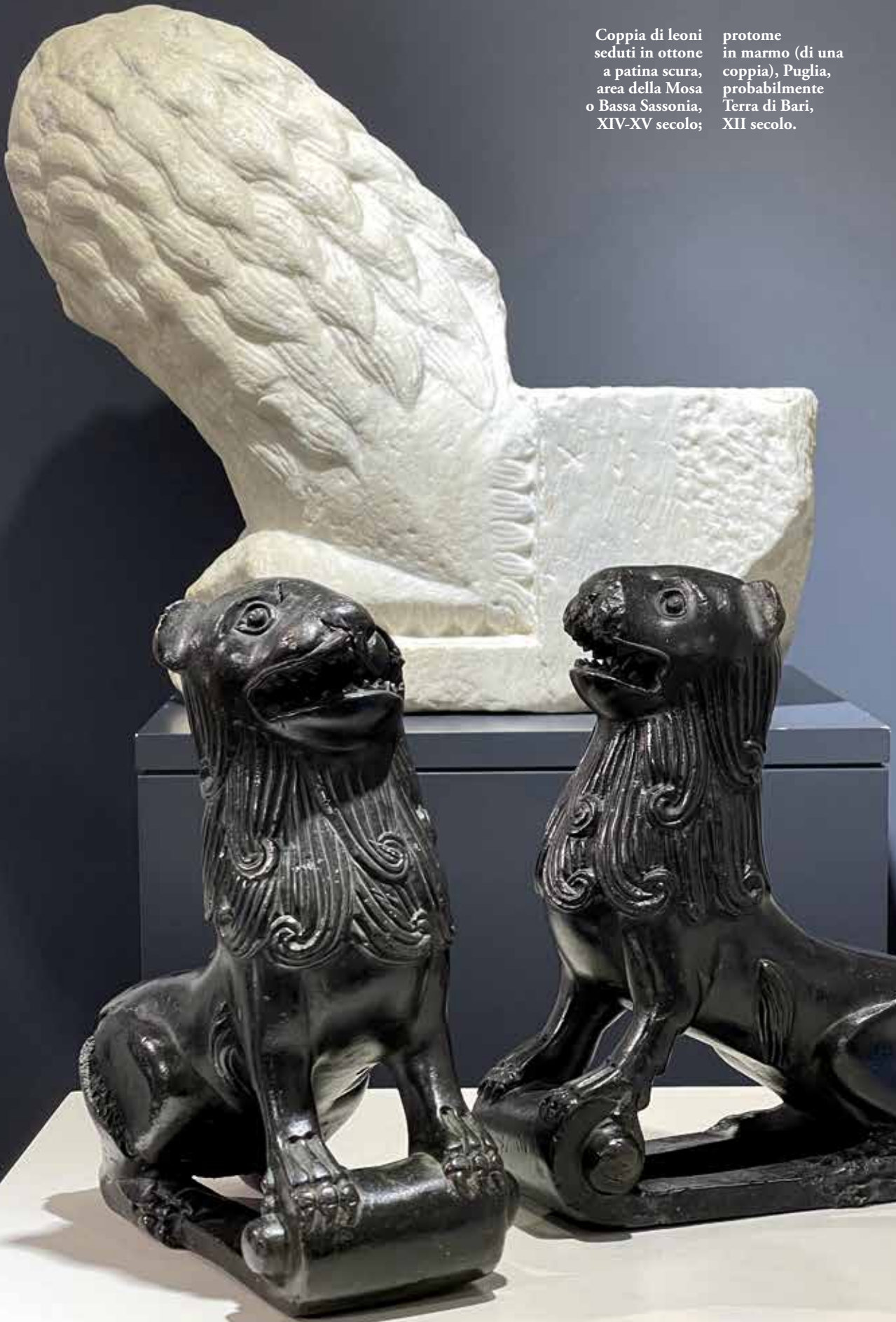
Coppia di leoni seduti in ottone a patina scura, area della Mosa o Bassa Sassonia, XIV-XV secolo; protome in marmo (di una coppia), Puglia, probabilmente Terra di Bari, XII secolo.