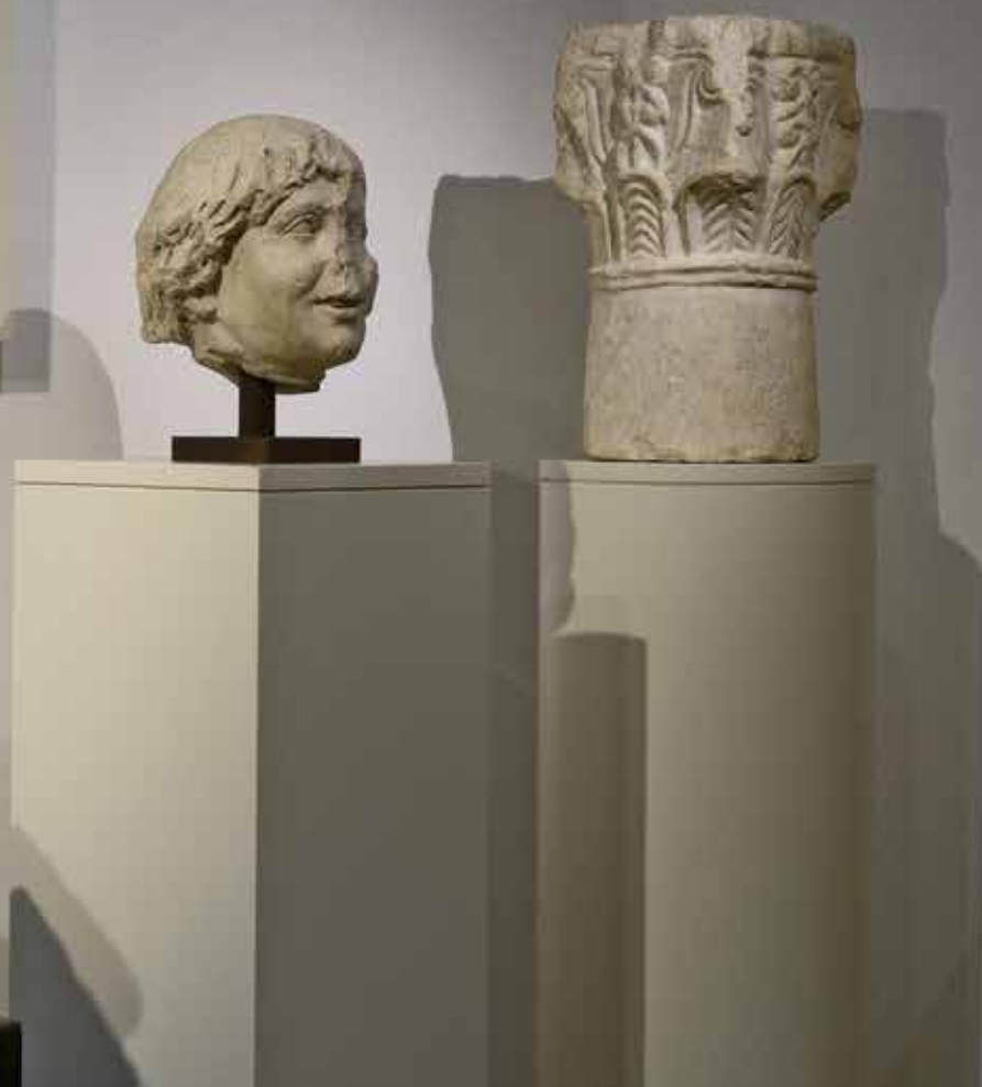
in marmo raffigurante sul recto pavoni con calice simbolico, IX-X secolo (sul verso, emblema dell'ordine degli Olivetani datato 1461).