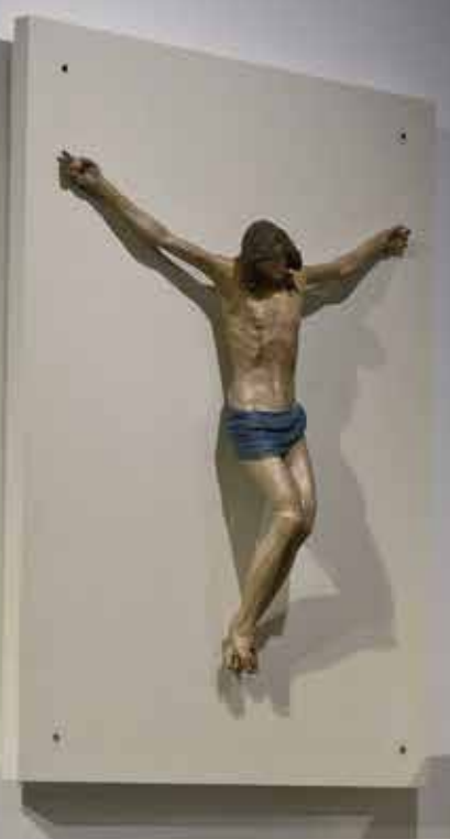
Uno scorcio del primo piano della galleria. Da sinistra: capitello toscano in marmo di Carrara, XII secolo; crocifisso ligneo di Felice Palma (Massa,